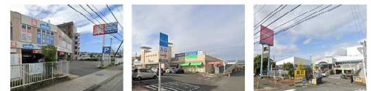
ウェルシア バシオス コーナンピーパー