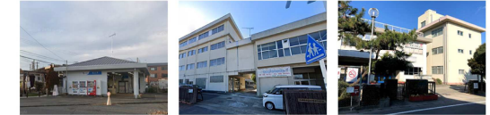
小田急線富水駅 東富水小学校 泉中学校