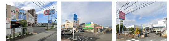
ウェルシア パシオス コーナンビーパー