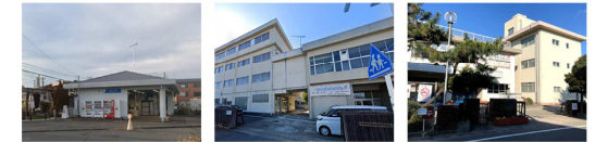
小田急線富水駅 東富水小学校 泉中学校