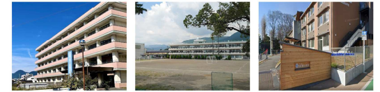
足柄上病院 松田中学校 松田小学校