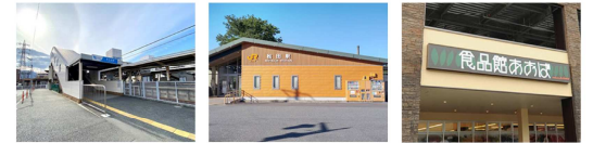
小田急新松田駅 J R松田駅 食品館あおば