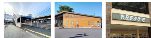
小田急新松田駅 J R松田駅 食品館あおば