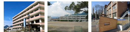
足柄上病院 松田中学校 松田小学校