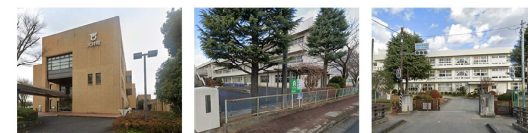
大井町役場 大井小学校 湘光中学校