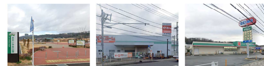
おおい中央公園 ビバホーム ドラッグセイムス