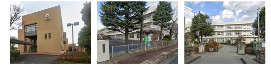
大井町役場 大井小学校 湘光中学校