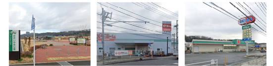
おおい中央公園 ビバホーム ドラッグセイムス