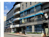
湯河原循環器 クリニック