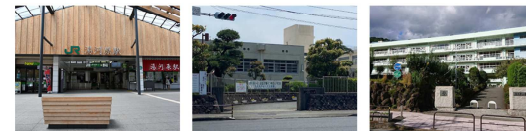
JR湯河原駅 湯河原中学校 湯河原小学校