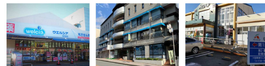
ウェルシア 湯河原循環器クリニック Aコープ湯河原店